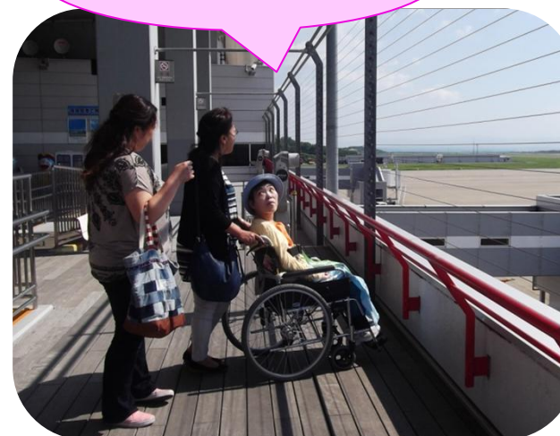
あ!飛行機が 飛んでるよ~!